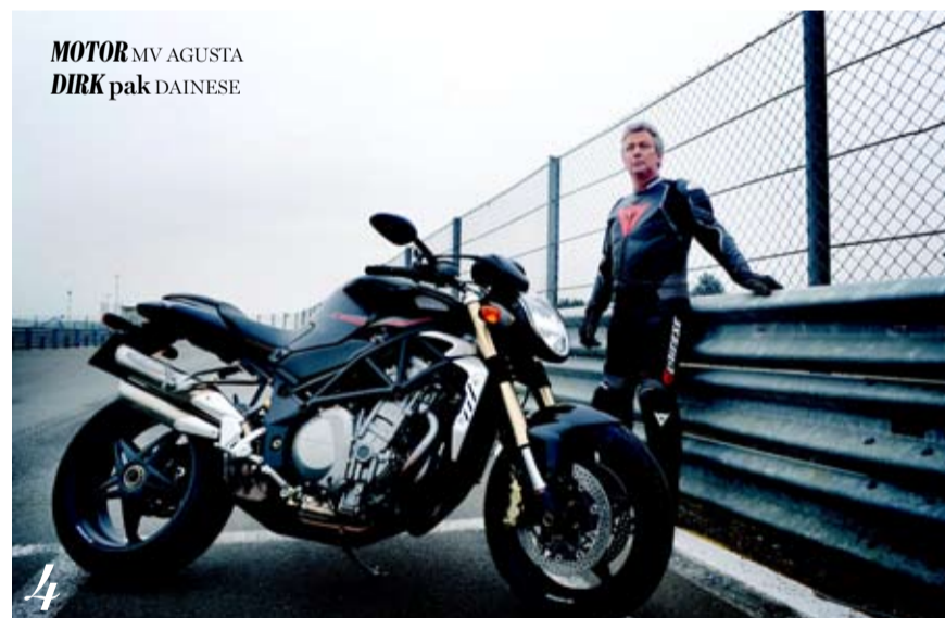
MOTOR MV AGUSTA DIRK pak DAINESE