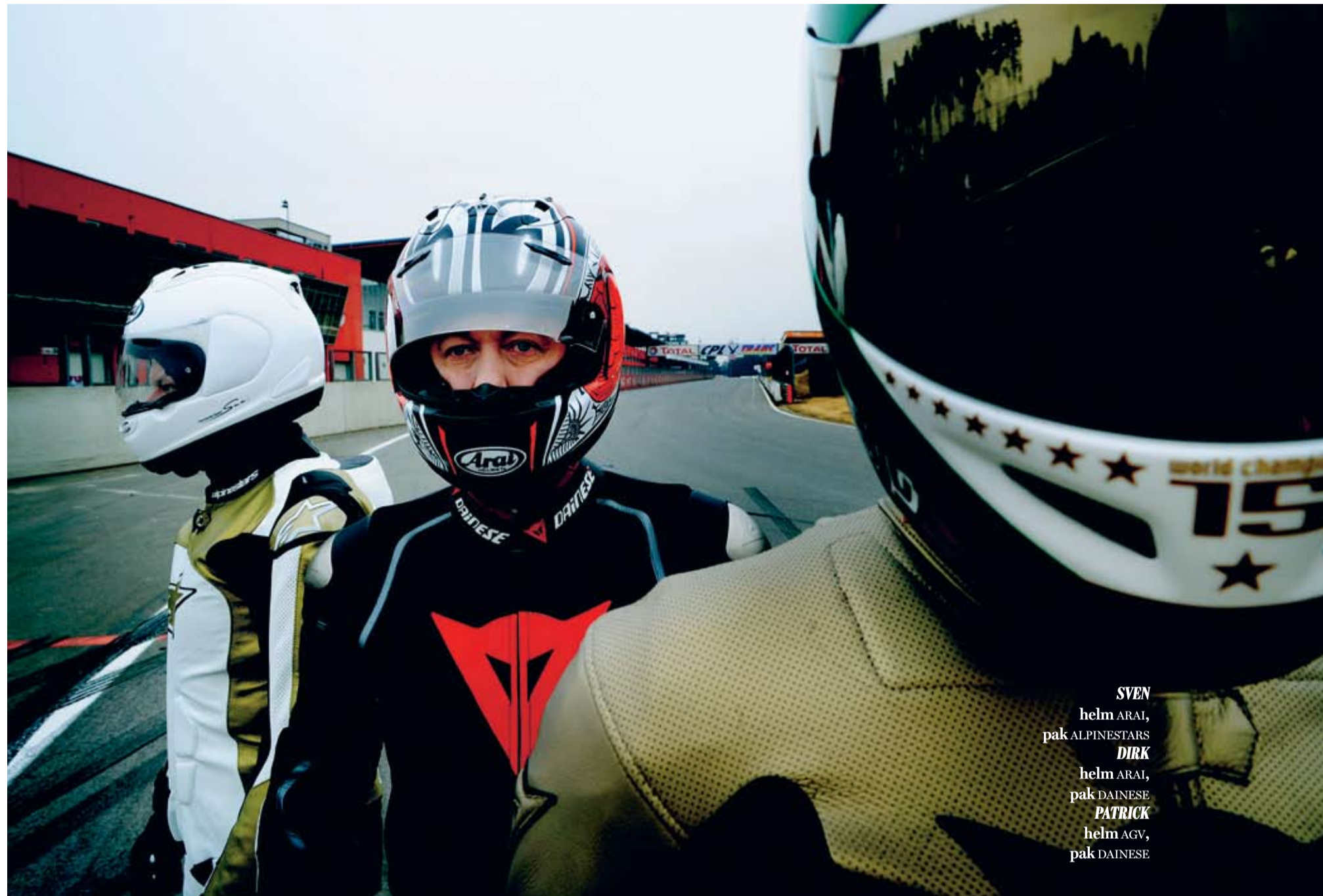
SVEN helm ARAI, pak ALPINESTARS DIRK helm ARAI, pak DAINESE PATRICK helm AGV, pak DAINESE