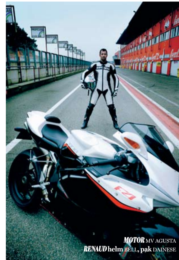
MOTOR MV AGUSTA RENAUD helm BELL, pak DAINESE

Je draagt een racepak om te laten zien dat je een 'echte' bent, dus mag je niet door de mand vallen. Op een modern racepak zitten plastic kneesliders : op elke knie een stuk hard plastic waarmee je de grond raakt bij snel bochtenwerk. Je laat je motor immers zo ver overhellen naar de binnenkant van de bocht, dat je je knie nodig hebt om je hellingshoek juist in te schatten en je weer lichtjes af te zetten om zonder brokken de bocht uit te rijden. Spiksplinternieuwe kneesliders , die de grond nooit hebben geraakt, zijn het beste bewijs dat je maar doet alsof, zeker als je pak al wat ouder is en je dus ruim de gelegenheid hebt gehad om je kneesliders te gebruiken. Kneesliders worden met velcro bevestigd en zijn dus vervangbaar. Voor wanhopige wannabe's worden op sommige tweedehandssites ook bijna opgebruikte sliders verkocht. Maar let op, een kenner ontmaskert je zo aan de slijtage van je achterband, dus dit trুকje werkt alleen als je motor er niet bij is. Wat evenmin goed is voor je geloofwaardigheid.