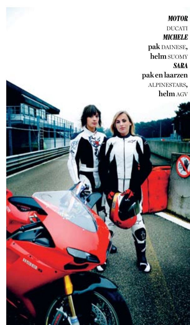
MOTOR DUCATI MICHELE pak DAINESE, helm SUOMY SARA pak en laarzen ALPINESTARS, helm AGV