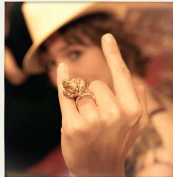
MARIKE Ring, Wouters & Hendrix, € 225 Hoedje, Maison Martin Margiela, € 120

'DE VOLGENDE KEER MAAK IK EEN PLAAT MET ZEVEN JANETTEN, DAT IS MINDER GEDOE'