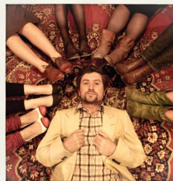
Hemd, Peak Performance Kostuumjasje, Dries Van Noten