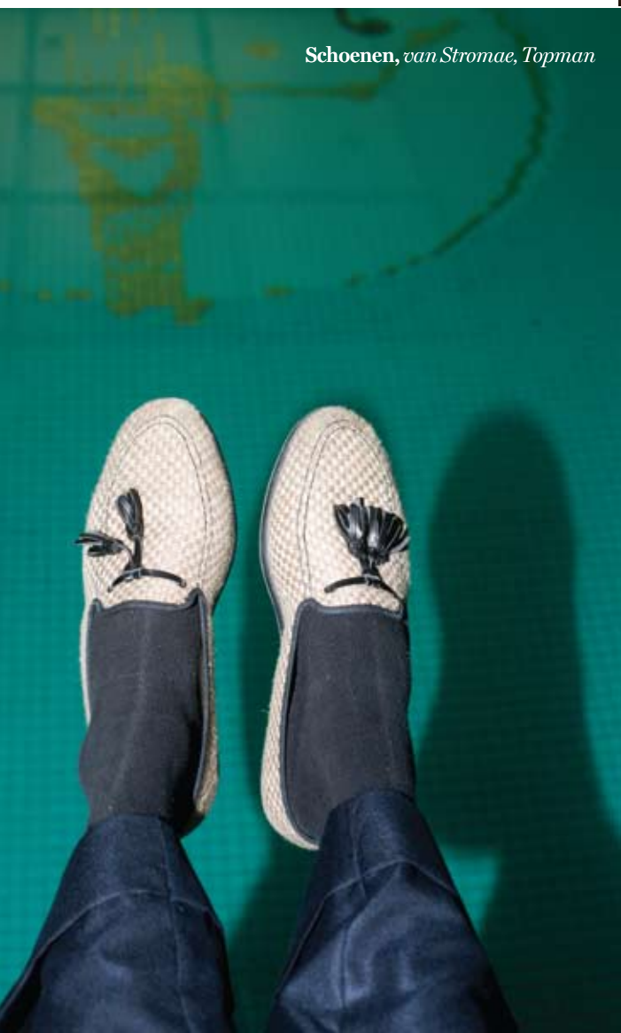
Schoenen, van Stromae, Topman

Hemd, € 49, M Chenasky bij Idiz Bogam Vestje, € 145, Olivier Strelli Strikje, € 85, Christophe Coppens Sneakers, € 345, Kris Van Assche bij Stijl