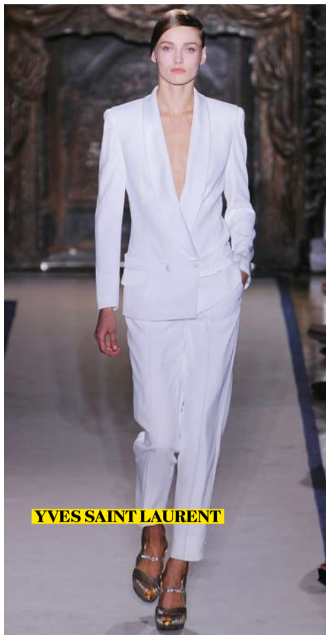
YVES SAINT LAURENT