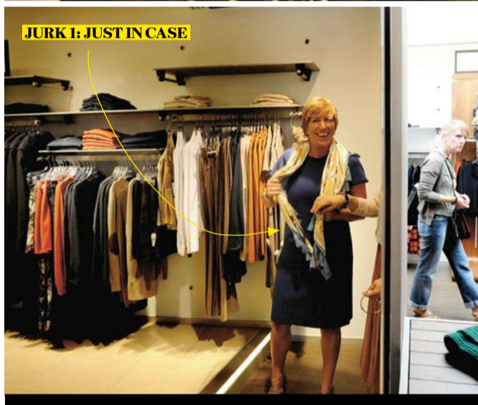
JURK 1: JUST IN CASE