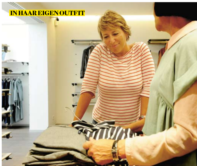
IN HAARE EIGEN OUTFIT