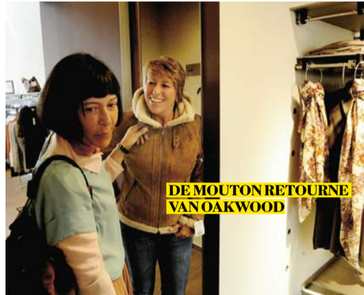
DE MOUTON RETOURNE VAN OAKWOOD