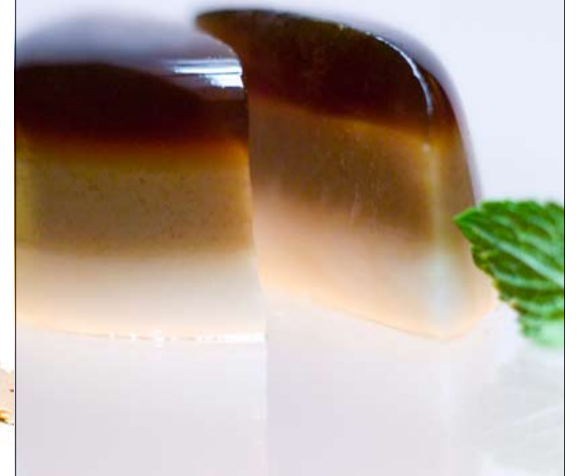
QUYEN THRUONG THI, LITTLE ASIA VANILLE-IJS MET KOFFIEGELATINE