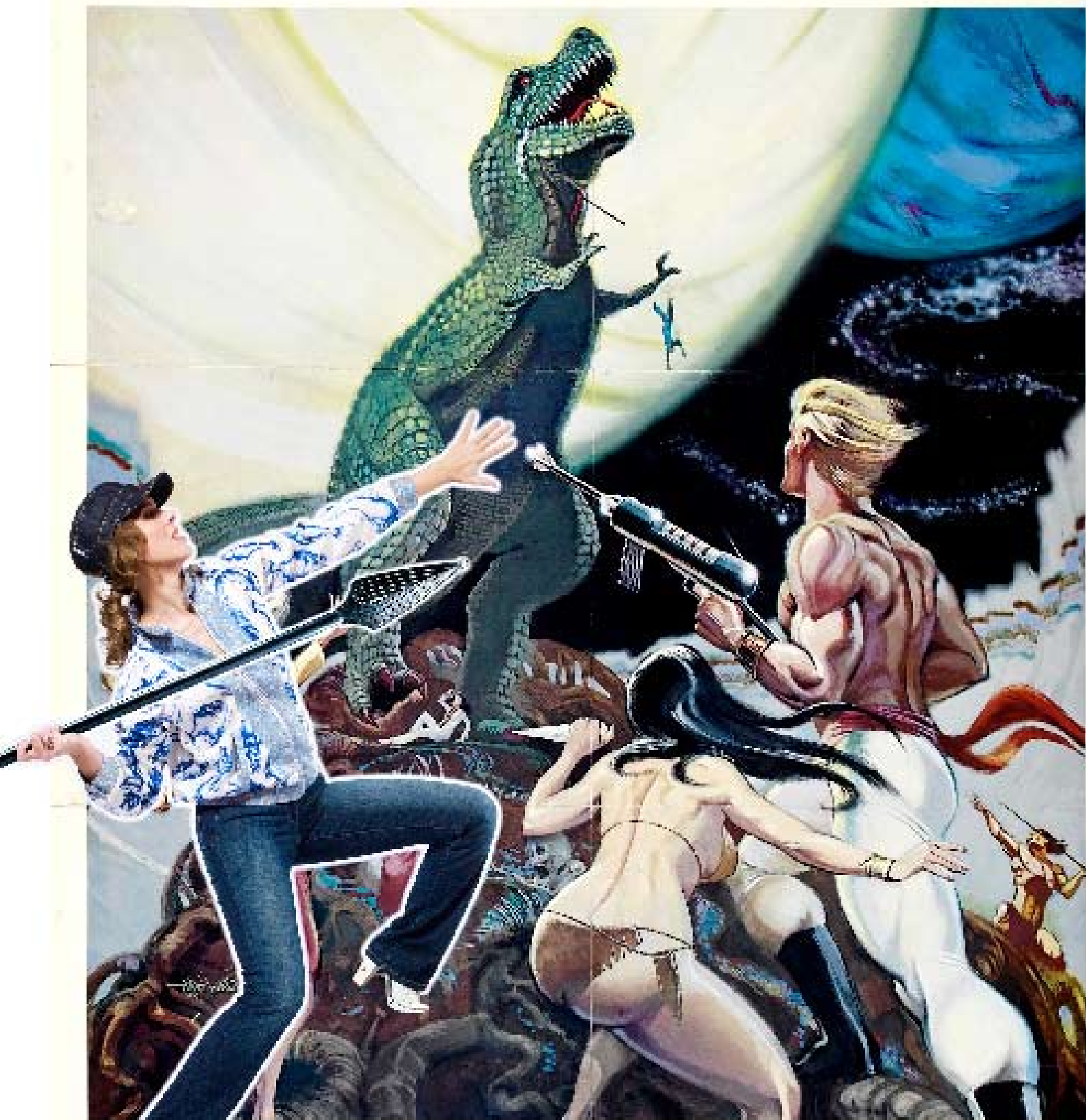
Zijden blouson met lurex €99 NY Raw special edition G-Star Jeans met push-upeffect €66 Salsa Petje €9,90 G-Star Laarzen €25 Diesel