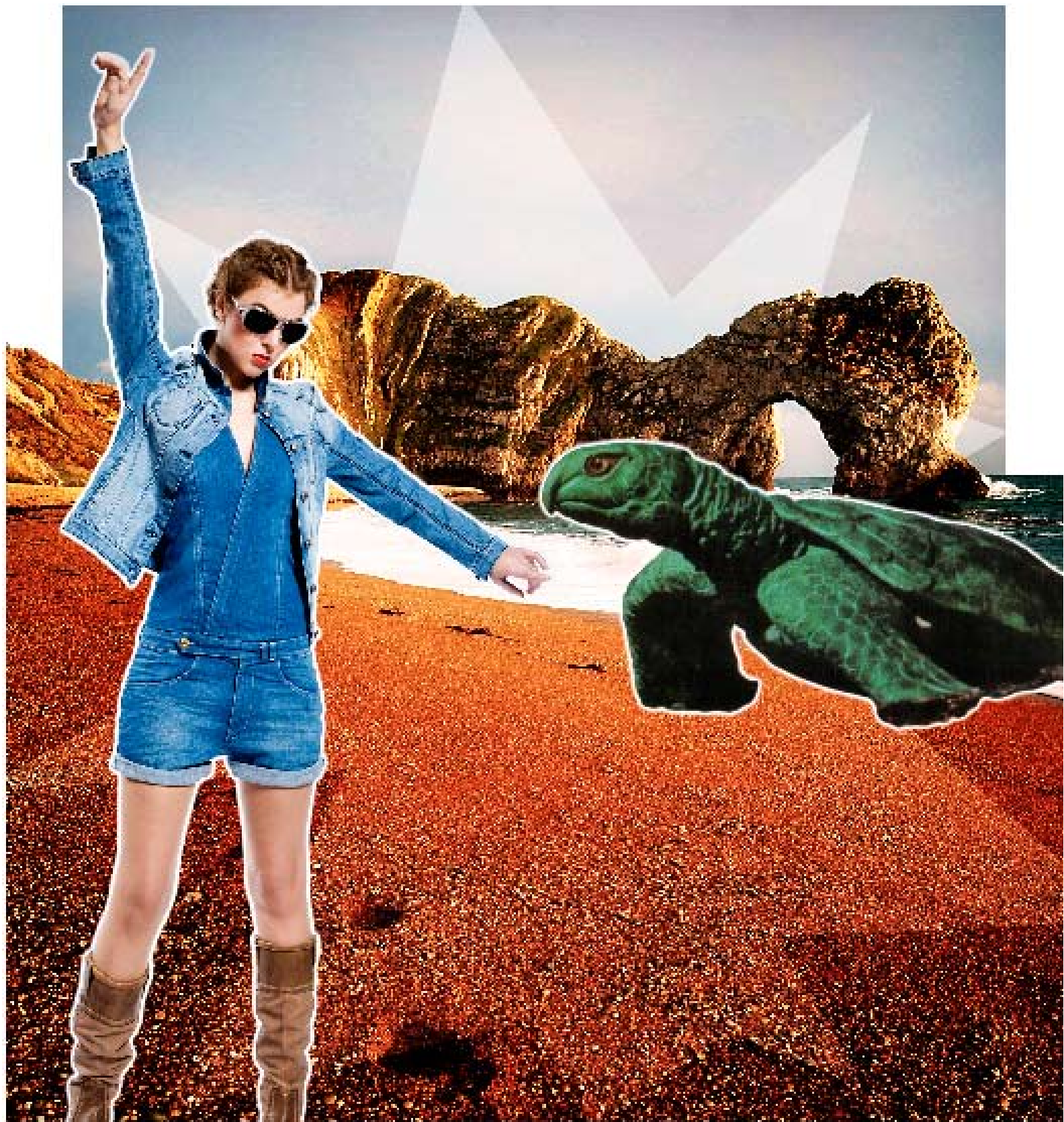
Salopette €30 Wrangler Jeansvestje €50 Zadig & Voltaire Laarzen €70 Timberland Zonnebril €39 Oakley