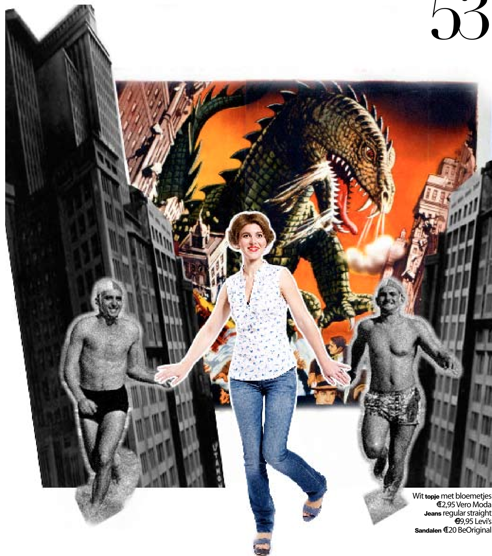
Wit topje met bloemetjes €2,95 Vero Moda Jeans regular straight €9,95 Levi's Sandalen €20 BeOriginal