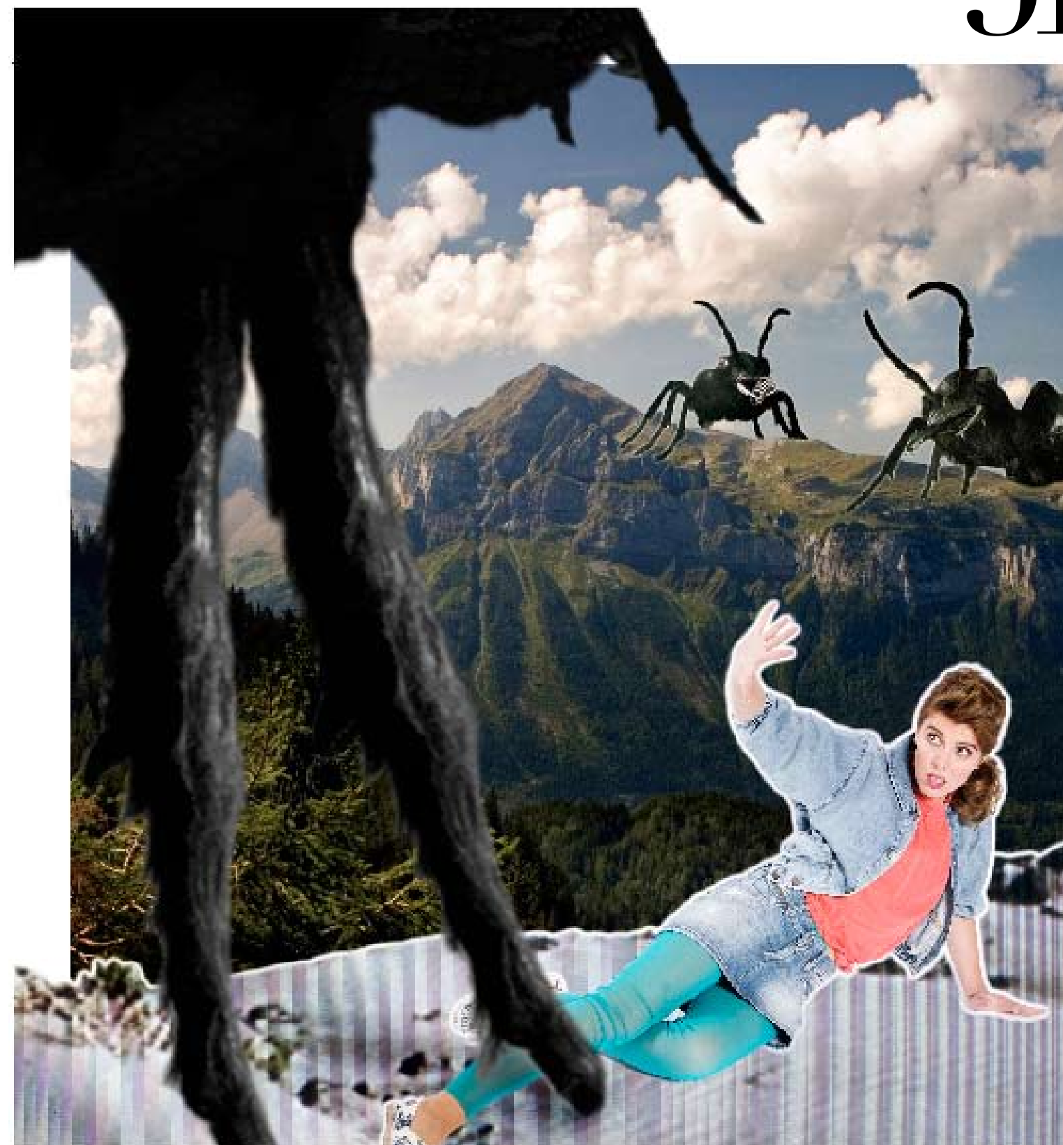
Denim minirok €30 Replay Zijden topje €25 Rue Blanche Jeansvestje €20 Killah Legging €0 Mais il est où le Soleil Espadrilles €9 Mellow Yellow